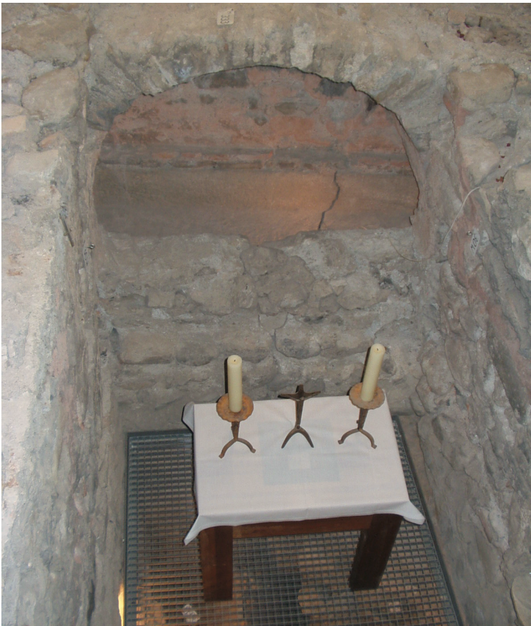
Abb. 1: Das in Saint-Maurice noch immer verehrte Mauritius-Grab in einem Kirchenbau aus karolingischer Zeit

Mit einer Legion Soldaten habe Maximian die Alpen überquert. Diese militärische Einheit sei aus der ägyptischen Thebais gekommen, einer Wiege