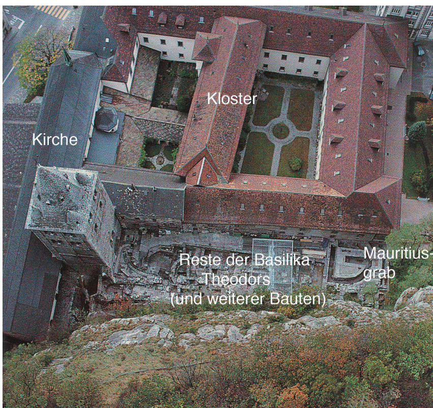
Abb. 2: Saint-Maurice und sein 515 gegründetes Kloster am Fuße einer mächtigen Felswand

Einige Jahrzehnte später entdeckte Bischof Theodor aus Martigny die sterblichen Überreste der Glaubenszeugen und ließ in Acaunus eine Kirche erbauen. Es entstand ein Wallfahrtsort und ein Kloster. Bischof Eucherius von Lyon (um 380 – ca. 450) hat als erster aufgezeichnet, was die Thebäer in Acaunus erlitten haben und wie Theodor für ihr Gedächtnis sorgte.