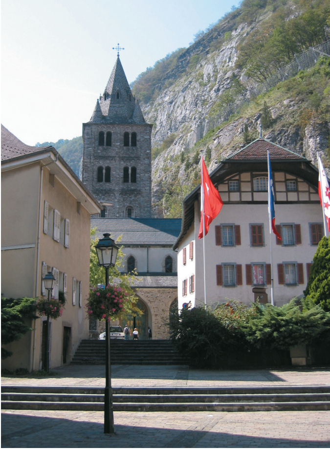
Abb. 3: Blick von der Stadt auf die Basilika der Abtei Saint-Maurice