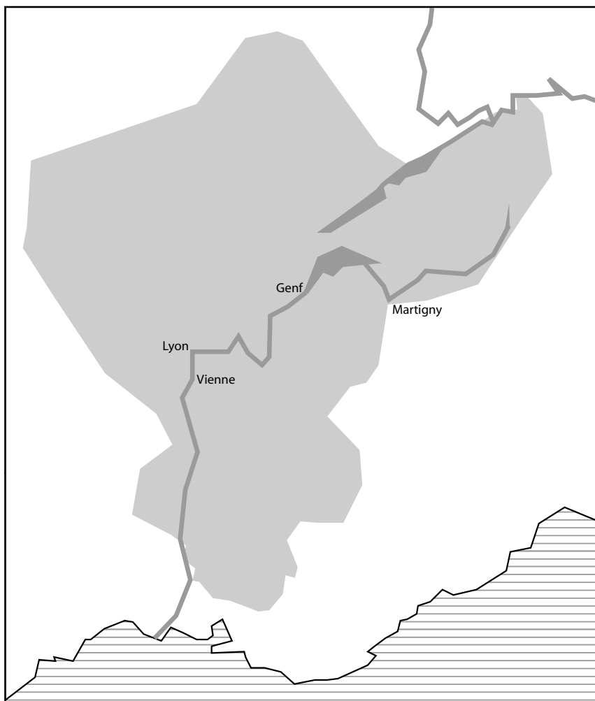
Abb. 5: Umfang der burgundischen Herrschaft zu Beginn des 6. Jahrhunderts nach der Teilnehmerliste des Konzils von Epaon.

zu interessieren. Im Raume des Burgunderreiches spielt die Geschichte des Martyriums der thebäischen Legion eine wichtige Rolle. Genf war die erste Residenz der Burgunder. Später wurde sie nach Lyon verlegt. Genf sank zum Sitz des Nebenkönigs ab. 515 trat Sigismund zur katholischen Orthodoxie über. Bischof Maximus von Genf riet ihm, die Martyriumstätte der thebäischen Legion durch ein Stift zu ehren, um für sich und sein Reich den Schutz der Heiligen zu gewinnen. Sigismund gründete daraufhin am Grab des Mauritius eine Abtei, die den liturgischen Brauch der laus perennis übernahm. Avitus von Vienne war dabei und predigte. Wenig später versammelte Sigismund die Bischöfe seines Reiches im Konzil von Epaon, wo auch die Oberhirten von Genf, Octodurus und Vindonissa teilnahmen.