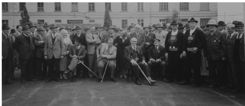
Fig. 1: Raduno dei veterani d’Africa a Bolzano, ottobre 1985

italiani, dunque, a condurre quella guerra, mentre i sudtirolesi, anche se indossavano la stessa divisa, ne erano estranei. Erano “gli italiani” che rifilavano ai soldati un cibo pessimo; “gli italiani” a mettere nel caffè una pillola per prevenire problemi di salute, ecc. 30 Attraverso il ricordo e il racconto si ribadisce una netta alterità dagli italiani, dal loro esercito e da un’impresa bellica non voluta. Difficile dire quanto tale alterità sia espressione dell’oggi in cui il ricordo prende corpo e parola e quanto dell’epoca cui quel ricordo si riferisce. Ascoltando le loro voci e scorrendo le centinaia di fotografie che ci hanno lasciato, appare evidente come i sudtirolesi in Africa facessero il più possibile gruppo a sé: insieme nelle baracche, insieme a festeggiare il Natale, insieme in posa davanti alla macchina fotografica. 31 Ma il legame tra correghionali è una costante dell’esperienza di guerra che non stupisce e che non segnala necessariamente una distanza incolumabile tra la piccola comunità di regione o di paese, il resto della spedizione e lo spirito della conquista.