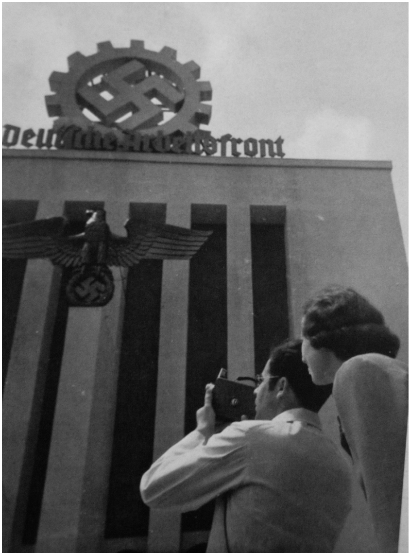
Ausstellung in Düsseldorf 1937 – Pavillon der Deutschen Arbeitsfront

Horizont hinaus – in unbekannte, lockende Ferne. Und noch im Frühsommer 1939, wenige Wochen vor Beginn des Zweiten Weltkrieges wirbt die NS-Gemeinschaft „Kraft durch Freude“ mit einem Plakat „555 Reisen“ für eine andere Zeit – es könnte die der 1950er-Jahre sein. Ein Paar, dessen Ziel die Ostseeinsel Rügen ist, lächelt dem Betrachter zu: Im Hintergrund kann man das riesige, im Rohbau gerade fertige KdF-Bad Prora erkennen. Warum so viel schöner Schein – auch mit „Worten aus Stein“? Ich sehe drei Ursachen, skizziere sie thesenartig und beginne