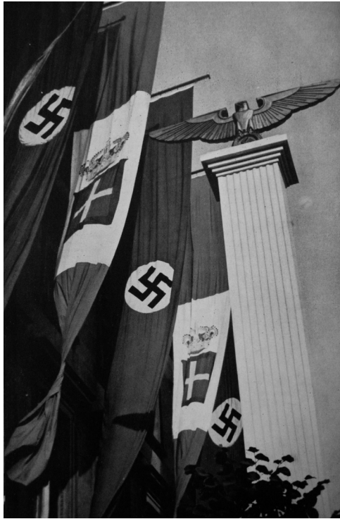
Beflaggung und Hakenkreuz-Säulen anlässlich Mussolinis Besuch bei Hitler (La rivista illustrata del Popolo d'Italia, 1938)

Leninismus. Seine Kunst kann nur diese Moral versinnbildlichen und verklären. Der Faschismus stellt eine „utopische Ästhetik“ zur Schau. 4 Das Kernstück der NS-Ideologie, die Rassenlehre, verlangt geradezu nach einer körper- und raumbetonten Veranschaulichung, ob im Bild des „nordischen Menschen“, des „Volkskörpers“, der „Volksgesundheit“, des „Volkes ohne Raum“. Sie war eine sich im Bilde darstellende Ideologie, mit einer scharfen, visuell fixierten Trennung zwischen Wir und Ihr, zwischen den „Hochwertigen“ und den „Minderwertigen“, den „Volksgenossen“ und den bio-politisch stigmatisierten „Fremdvölkischen“. Während das typisierte Leitbild des „nordischen Menschen“ allgegenwärtig war, in den überdimensionierten Skulpturen Arno Brekers, Josef Thoraks u. a., sowie als Kunst am Bau, wurden die „Gemeinschaftsfremden“ unsichtbar gemacht, bevor man sie ermordete. Man sieht sie beim Verlassen des lebensgemeinschaftlichen Raumes – die Deportierten marschieren aus den Bildern hinaus, am hellen Tage, vorbei an den Zuschauern und Fotografen, die neugierig am Straßenrand stehen. Der NS-Staat konnte und wollte viel weniger verbergen als man später vorgab, zur eigenen Schuldentlastung.