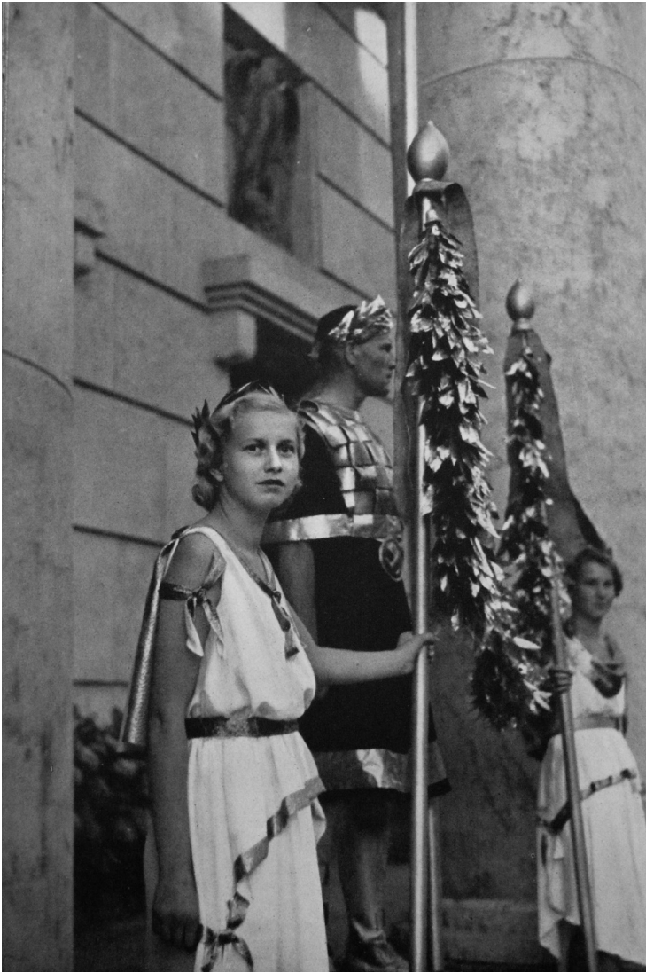
„Der Pavillon der deutschen Kunst“ anlässlich der Triennale von Mailand 1936 (La rivista illustrata del Popolo d'Italia, 1937)

Ganz offensichtlich nimmt es auf Schinkels Altes Museum in Berlin Bezug, setzt sich damit aber Vergleichen aus, die, so der Architekturhistoriker Karl Arndt zugespitzt, nur seine „Schwächen enthüllen“. Denn „Antike und Klassizismus ließen sich, mit welchen Ausdrucksabsichten auch immer, noch zitieren, nicht aber mehr fruchtbar weiterentwickeln“. 14 Sieht man darüber hinaus und in das Innere, also hinter die Kulissenarchitektur,