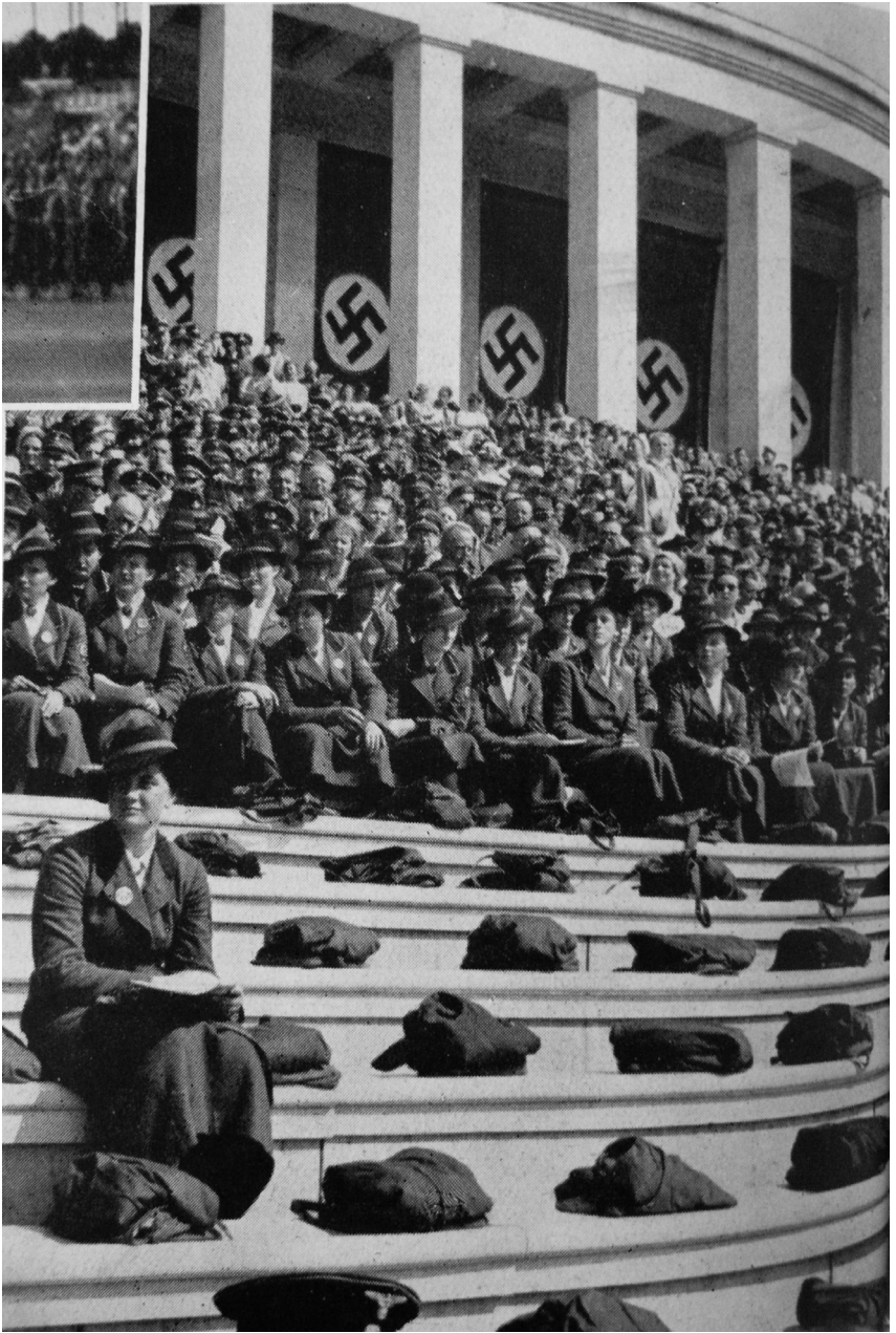
Frauen einer NS-Organisation in Reih und Glied als Zuschauerinnen in Nürnberg (La rivista illustrata del Popolo d'Italia, 1937)

1. Mai 1933, improvisierte er auf dem Tempelhofer Flugfeld aus Gerüsttribünen, Scheinwerferlicht und Fahnentuch Filmkulissenarchitektur und bekam viel Beifall. Speers Lehrer Heinrich Tessenow befand: „Es macht Eindruck, das ist alles“. Aber darauf kam es an, Hitler vor allem.