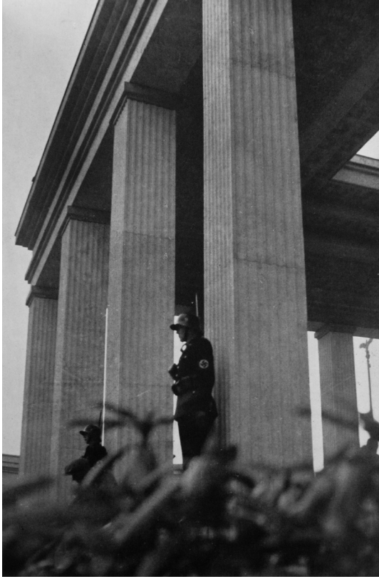
Wache an der Feldherrnhalle in München. Der Kult des Totengedenkens an die „Helden“ ist zentrales Element des Nationalsozialismus. Gefeierte wird der Heldentod, nicht das Leben (La rivista illustrata del Popolo d'Italia, 1937)