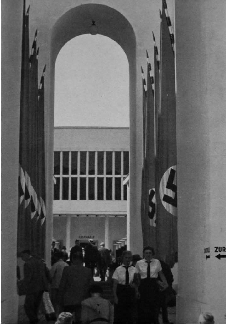
Ausstellung in Düsseldorf 1937 – „Schaffendes Volk“

in München, der „Hauptstadt der Bewegung“, und in Nürnberg, der „Stadt der Reichsparteitage“.