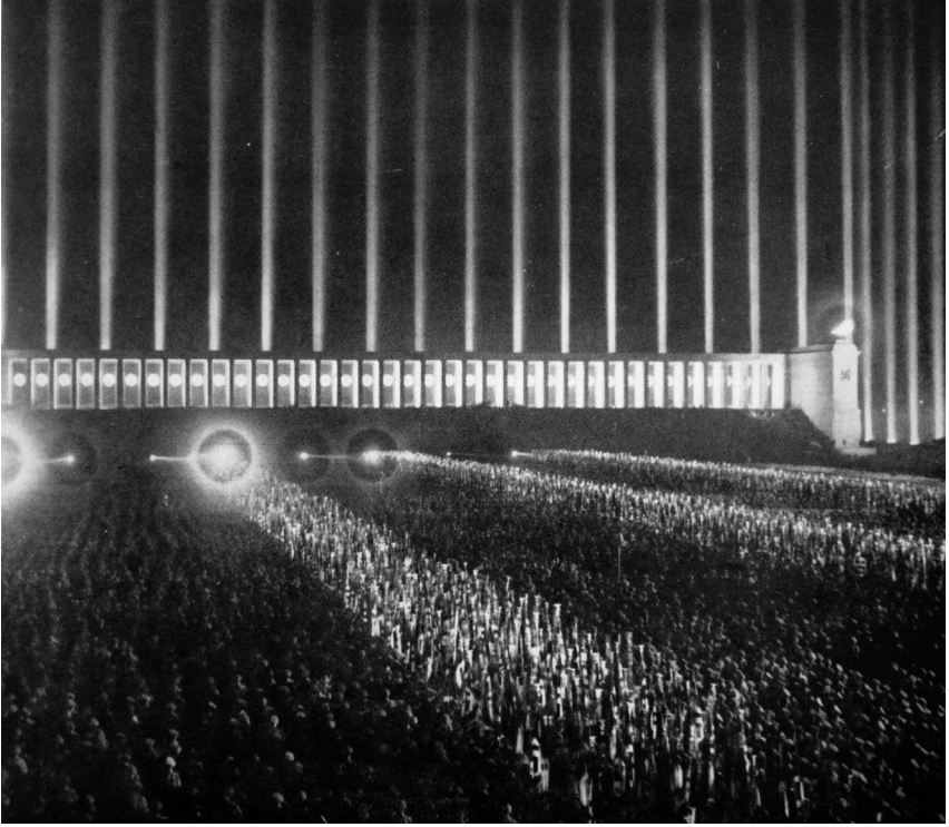
„Lichtdom“ – Inszenierungen Albert Speers mit Licht und „schönem Schein“ am Reichsparteitag in Nürnberg 1937 (La rivista illustrata del Popolo d'Italia, 1937)